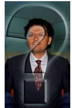
Omicidio Bottari: 4977 giorni senza risposta.